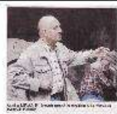
Portrait of a man in a military uniform, likely a participant in the commemoration.