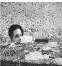
Combat dans la propriété des Dupré, rue Gouverneur