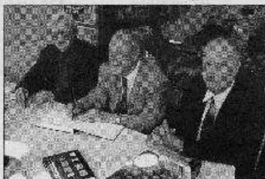
■ Après le livre, un DVD est bientôt prévu autour de l'histoire des maquisards de Plainville.