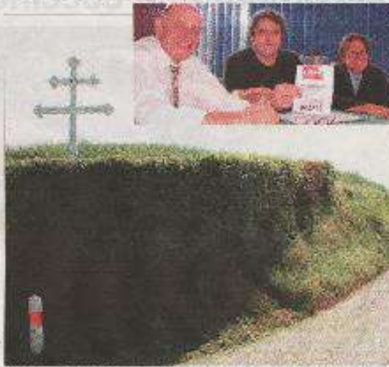
Mardi 23 juin, à 19 heures, le lycée Rémi Belleau a organisé une projection du film Les murs de la mémoire .

Le film Les murs de la mémoire est un documentaire qui raconte l'histoire de ces quatre résistants. Le film a été réalisé par les élèves de la classe de terminale A du lycée Rémi Belleau. Le film a été projeté dans la salle de cinéma du lycée Rémi Belleau.