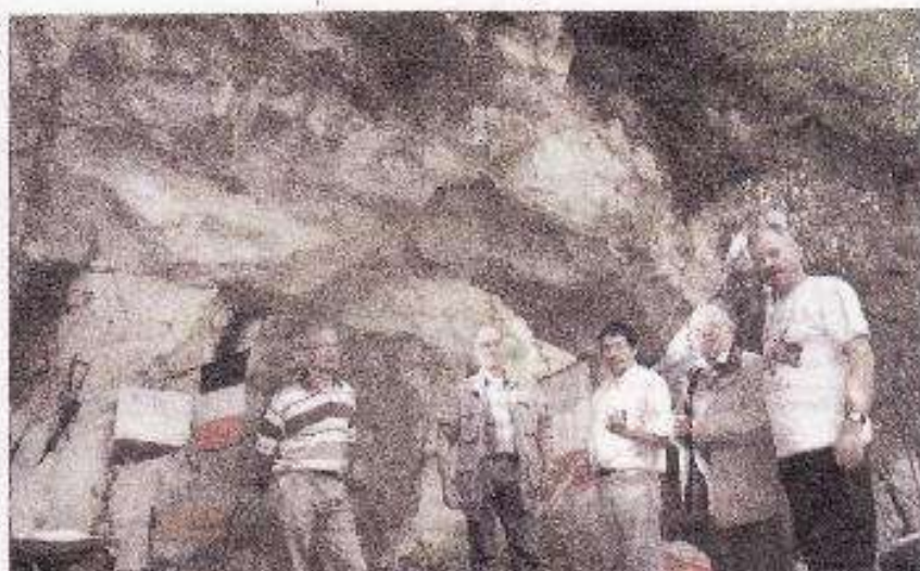
Marolles-les-Buis, dimanche 26 juillet. Les associations des Amis et des anciens résistants du Maquis de Plainville, et lors de la dernière visite en date, seront mobilisés lors de cette journée spéciale liralar.