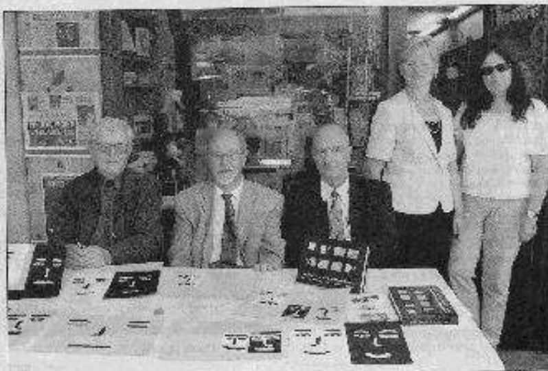
Les résistants veulent encore témoigner de leur histoire

de-vous le 26 juillet après-midi au Maquis de Flainville pour une visite guidée et au cinéma nogentais qui proposera