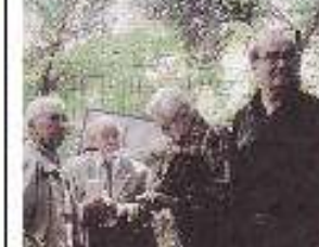
Portrait of a man in a military uniform, likely a participant in the commemoration.