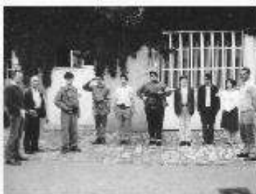
Déjeuner. Réunion avec le maire et le sous-préfet après une visite au musée de Plainville