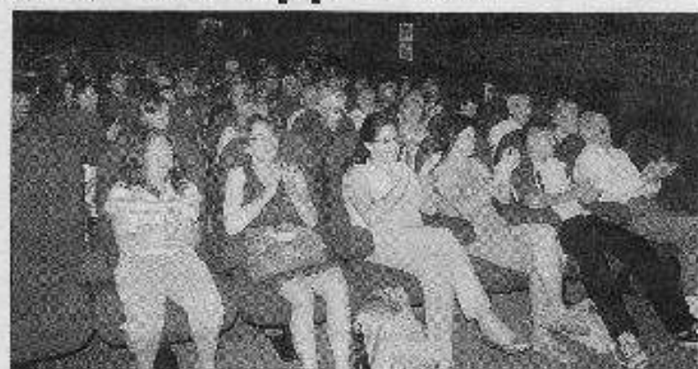
Dans la salle de cinéma le Rex, les spectateurs se sont applaudis en nombre.

Les élèves de terminale A du lycée Rémi Belleau, l'équipe enseignante et la direction ont été récompensés pour leur travail. Le film Les murs de la mémoire est diffusé au cinéma Rex. Le film est une suite au livre Les murs de la mémoire qui a été écrit par les élèves de la classe de terminale A du lycée Rémi Belleau.